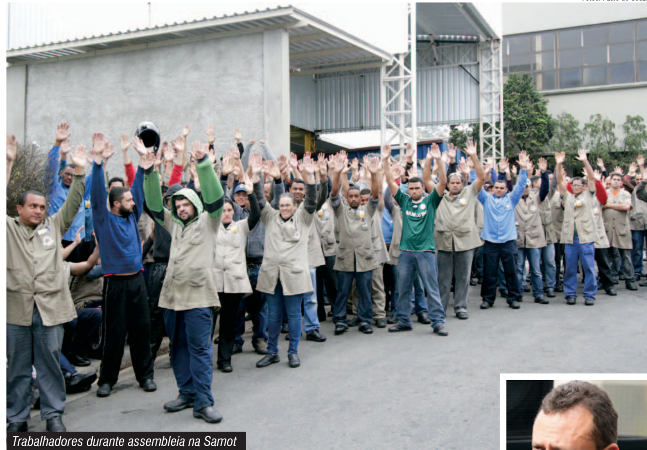
Trabalhadores durante assembleia na Samot

Segundo o dirigente, dentre os principais itens em negociação estão a terceirização, Plano de Cargos e Salários, pressão por parte da chefia, atuação da CIPA, melhoria no plano médico, transporte, Participação nos Lucros e Resultados 2014